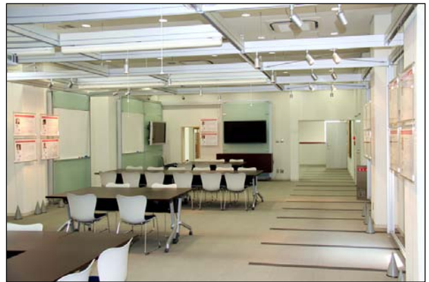
iCeMS 本館 2F 展示室