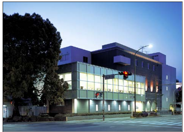
iCeMS 本館（「東山東一条」交差点 北西角）