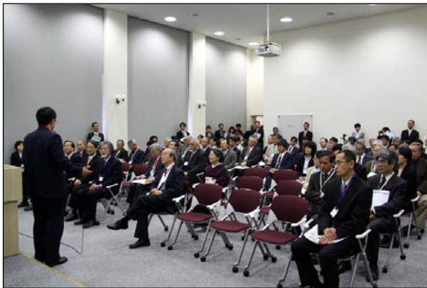
iCeMS 本館 2F セミナー室